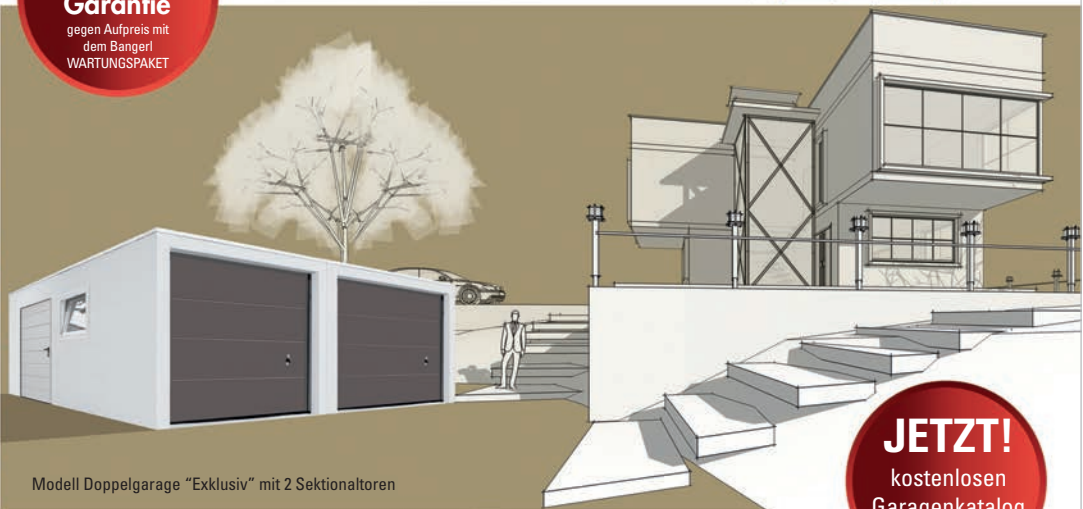
Modell Doppelgarage "Exklusiv" mit 2 Sektionaltoren